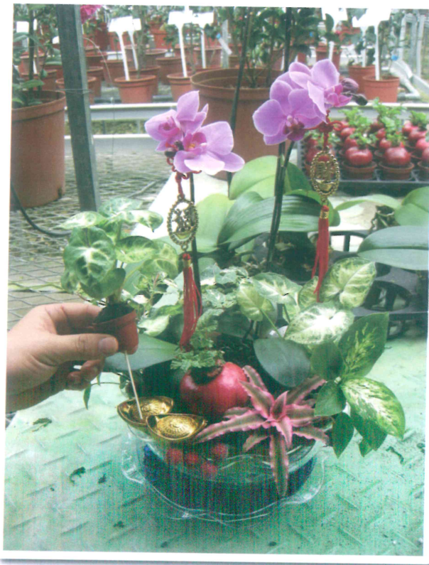
小品盆花自動給水盤製作的組合盆栽