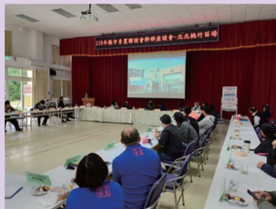
▲青農們觀看本場「都市農耕」的介紹影片。