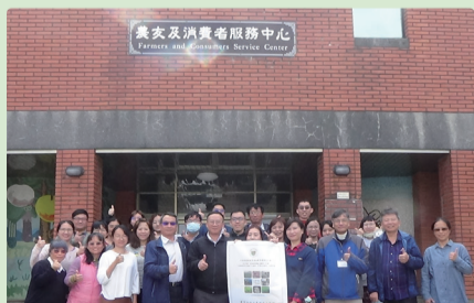
▲3月12日農業研發成果運用工作坊團體照

未來將持續規劃「T-PLAN策略和實際案例分享」和「研發成果案例和評價思維邏輯」相關課程，以利更精進本場研究人員之研發動能，讓研發成果技術運用上能更貼近產業發展。