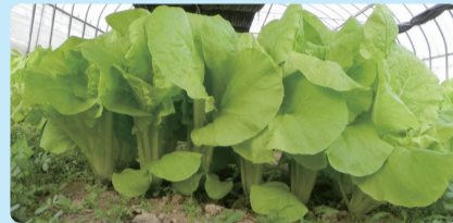
▲小白菜‘桃園1號-金脆白’植株立面照。