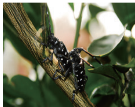
▲星天牛咬破皮層成丁字形裂縫，產卵。