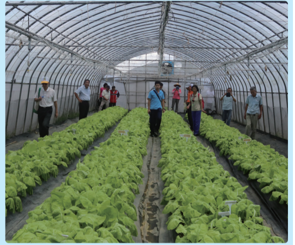
▲小白菜‘桃園1號-金脆白’及‘桃園2號-嫩香白’示範觀摩會。