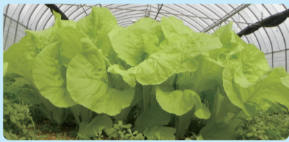
▲小白菜‘桃園2號-金脆白’植株立面照。