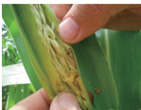
▲玉米螟幼蟲取食危害玉米幼穗。