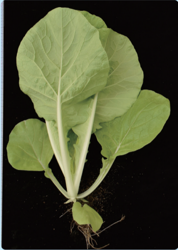
▲小白菜‘桃園1號-金脆白’葉色淺綠色、葉姿直立、葉質柔嫩。