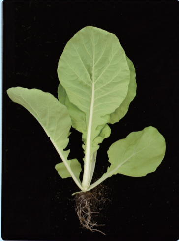
▲小白菜‘桃園2號-嫩香白’葉色淺綠色、葉姿半直立、葉質柔嫩。