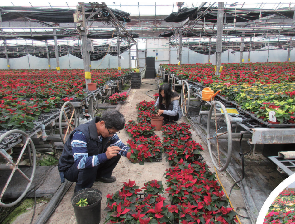
▲ 聖誕紅生產已是吳家肩負的使命