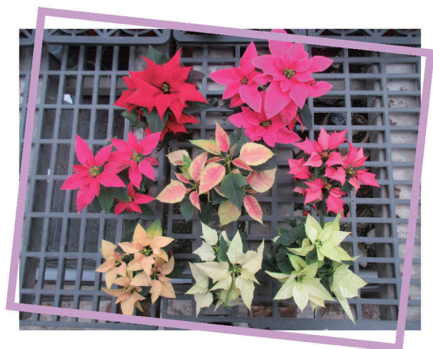
▲ 尚群園藝常年生產的聖誕紅品種：聖誕節(紅色系)、倍利(粉、白、雙色)、金色秋天(黃色系)等

降。「今年有造景工程廠商，訂購了8,000盆聖誕紅，是第1次接這樣的訂單，雖然往年也都能夠把盆花賣的差不多，而這樣的大訂單，盆花可以賣得比較快！」欣蓓眼睛一亮的提起潛力股。