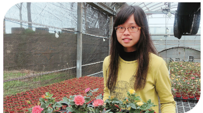
▲ 欣蓓曾經嘗試的玫瑰盆花