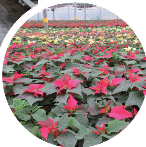
▲ 尚群園藝網室裡栽培著等待出貨的聖誕紅盆花

入國立屏東科技大學，在學期間讓她學習了更多作物的管理知識，例如水稻、蔬菜等；欣蓓又說：「高中時，因為實習課有種菜，假日需要澆水管理，媽媽剛好在巨蛋旁邊的桃園假日花市擺攤賣花，所以假日都會在花市幫忙一起賣花，能學習面對面的各種銷售竅門。」