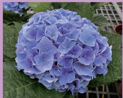
▲ 繡球花將成為尚群園藝春季時期的主力盆花，3月份即可陸續出貨