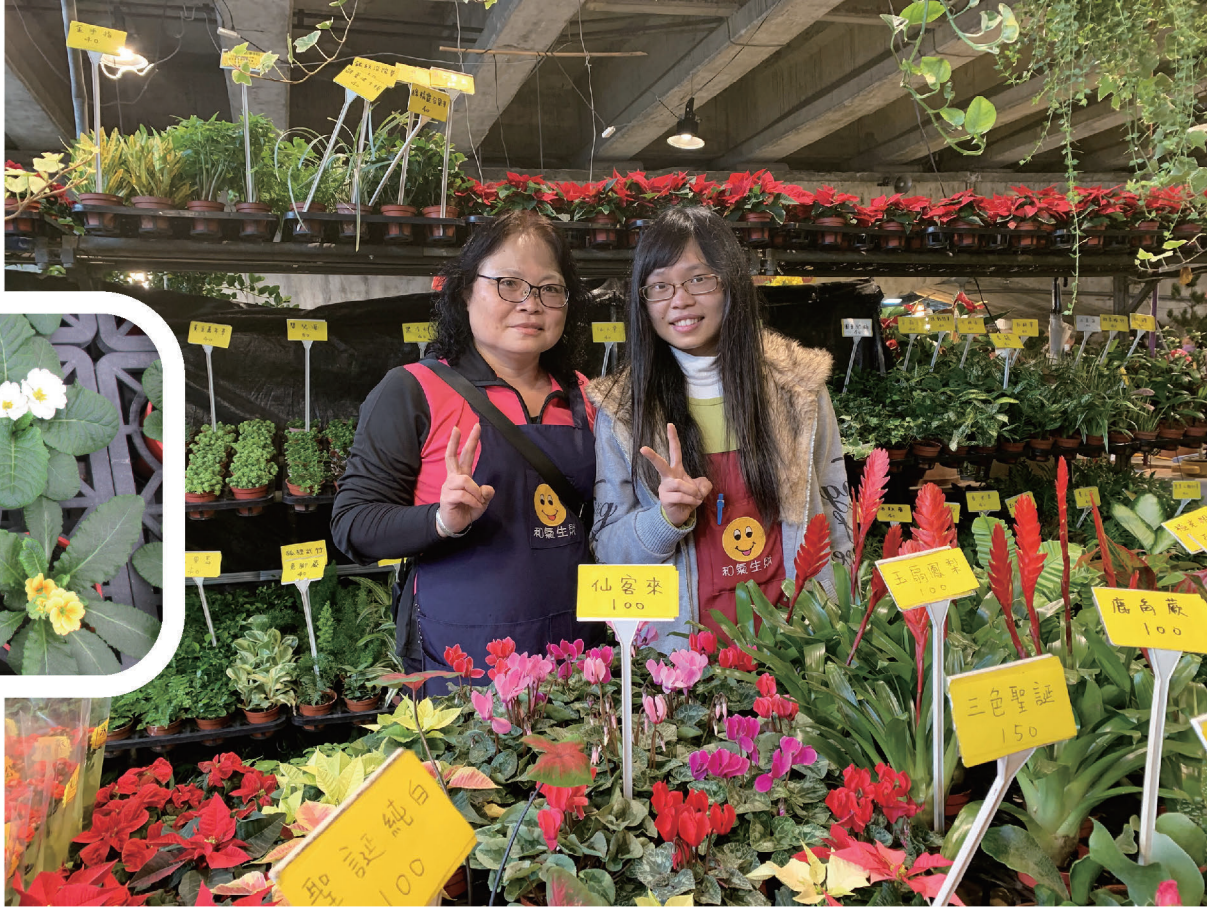
▲ 欣蓓與媽媽假日都在桃園假日花市經營零售事業