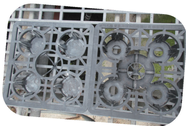
▲ 具專利案號的定量淹灌系統結構(左)及其改良式(右)

51個品種權申請案，其中，不乏由合作夥伴代理進口申請品種登記，如常見的聖誕紅紅色系品種：聖誕節（德國品種）。「不過，它植株較大不適合小盆，往後以5、7寸大盆為主，明年開始3、5寸盆將改由“尚紅（荷蘭品種）”為紅色系主力」。欣蓓補充並接著說明：「其實，長壽花也是他們的建議，才變成我們的主力生產項目。剛好是我畢業後的那年過年期間，在假日花市裡的花卉品項多，又總是叫不到貨，種苗商便問我們要不要自己做，才開始了長壽花的生產，都是以他們從國外引進的重瓣品種作栽培。」