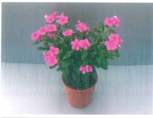
日日春桃園 3 號-紅蝴蝶 5 吋盆栽