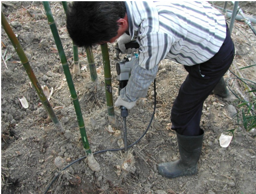
圖 3. 電動清竹頭機操作

本項電動清竹頭機使用電源為 110 V×60 Hz，消耗電力為 1,050 W，由單人操作。操作者一手持握把，另一手持卡掣槽，以握把在上，鑿刀在下的方式，藉由機件及人的重力，將鑿刀頭對準欲切除物之位置，施加重力及衝擊力將之切除（圖 3）。