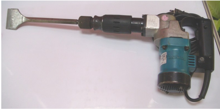
圖 4. 電動清竹頭機全機圖